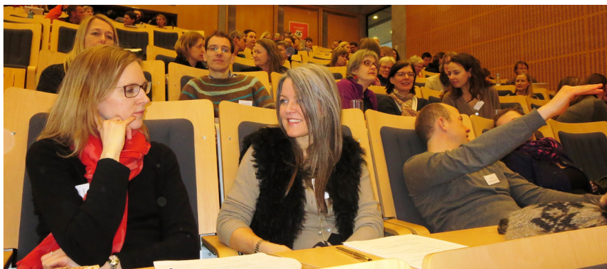
Ca. 120 personer deltog på seminaret, der foregik på Syddansk Universitet.

I centret er vi meget interesserede i at dele vores viden med praktikere og har allerede i år afholdt to arrangementer: Den sunde skole? og Alkoholforebyggelse, hvad virker? i hhv. januar og februar. Intentionen med arrangementerne er at bidrage til at inspirere aktører, der arbejder med sundhedsfremme, og samtidig skabe rum for dialog og erfaringsudveksling blandt deltagere og forskere.