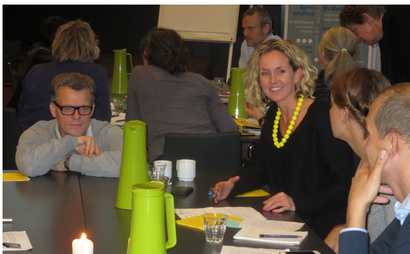
Interventionsforskning for feinschmeckere. Forskere fra Center for Interventionsforskning udvekslede erfaringer og viden.

Hvordan får vi vores viden og forskning ud til praktikere, hvordan evaluerer man komplekse interventioner, og hvordan anvender man "mixed methods", hvilket måske bedst kan oversættes til, hvordan man anvender forskellige videnskabelige metoder i ét og samme studie.