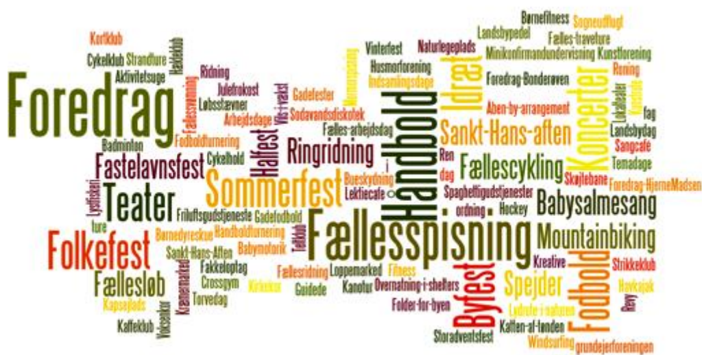
Figur 3: De af respondenterne fra de otte landsbyer nævnte landsbyaktiviteter

I alle interview fyldte udsagn og fortællinger omkring lokale aktiviteter, arrangementer, foreninger, ildsjæle og engagerede landsbyboere en del, og der var generelt stor stolthed over det, som kunne kaldes 'landsbylivet'. Aktiviteterne spændte vidt fra for eksempel byfest og kræmmermarked, til babysalmesang og lektiecafé, korsang og foredrag, fællesspisning og kunstruter, strikkeklub og fastelavnsfest. Dertil kommer idrætsrelaterede aktiviteter som for eksempel mountainbike og cykelløb, crossfit, børnefitness, gymnastik, fodbold, håndbold, havkajak, bueskydning og løbetræning for at nævne nogle af eksemplerne. Figur 3 nedenfor viser de mange aktiviteter og arrangementer, som respondenterne nævnte i forskellige sammenhænge gennem interview. Jo flere gange en aktivitet eller arrangement er nævnt, des større og mere markeret tekst.