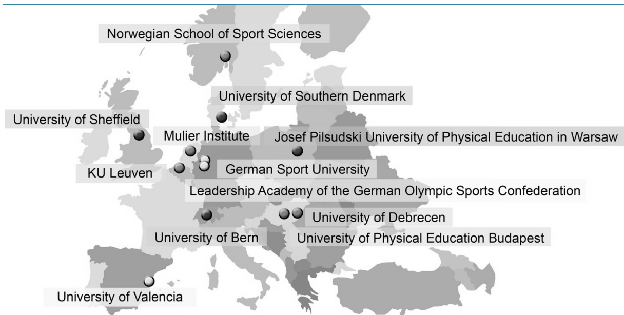
Fig. 1: SIVSCE Partnerskab

Deltagende lande blev nøje udvalgt, så forskellige typer af lande og idrætssystemer er repræsenteret → Fig. 1.