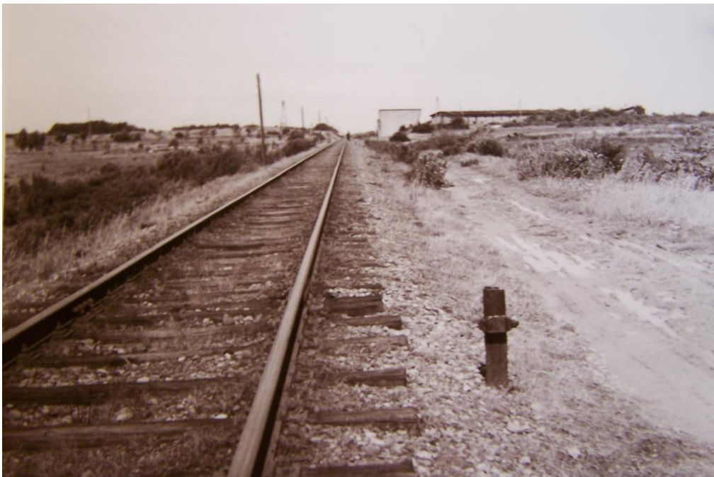
Jernbanesporet ved Schwesinglejren. En barak skimtes til højre. Foto: Jørgen Poulsen 1950. Aabenraakredens arkiv, Landsarkivet for Sønderjylland

Efterfølgende er de nye beboeres første opgave at fylde en papirsæk med halm, der til lejligheden er blevet kørt dertil og ligger i en stor stak. Den fyldte sæk er fangerens madras i barakkernes køjesenge, i Husum er de kun i to etager, i Neuengamme var der tre. 387 Denne luksus, der betød, at de snart afkræftede fanger ikke skulle bruge yderligere energi på at klatre op i den øverste køje, hidrørte sandsynligvis fra lejrens tidligere anvendelse. Da yderligere 1000 fanger senere kommer til lejren, bliver antallet af liggepladser dog til en ulempe, der først udlignes i takt med, at fangerne hurtigt mister legemsvægt og derved får lettere ved at dele køjen. Nattero var dog en luksus, der ikke eksisterede i koncentrationslejren. Fangerne oplevede derfor også hurtigt lejrens daglige chikaner. En måde at chikanere fangerne på var at vække dem om natten ved at give luftalarm. Dette var meningsløst, dels fordi der aldrig kom fly, der angreb lejren ved disse alarmer, og dels fordi der ikke var noget beskyttelsesrum i lejren. Det eneste fangerne skulle var at stå ved siden af deres senge, indtil alarmen på et tidspunkt blev afblæst af SS. De udmattede fanger fik efter en time lov til at gå i seng, men risikerede efter nogen tid igen at blive udsat for "luftalarm" samme nat. Om morgenen skulle fangerne rede deres senge, hvilket i koncentrationslejrene også var en form for chikane og hvor fangerne blev straffet hårdt, når ikke sengene blev redt ordentligt. Da der