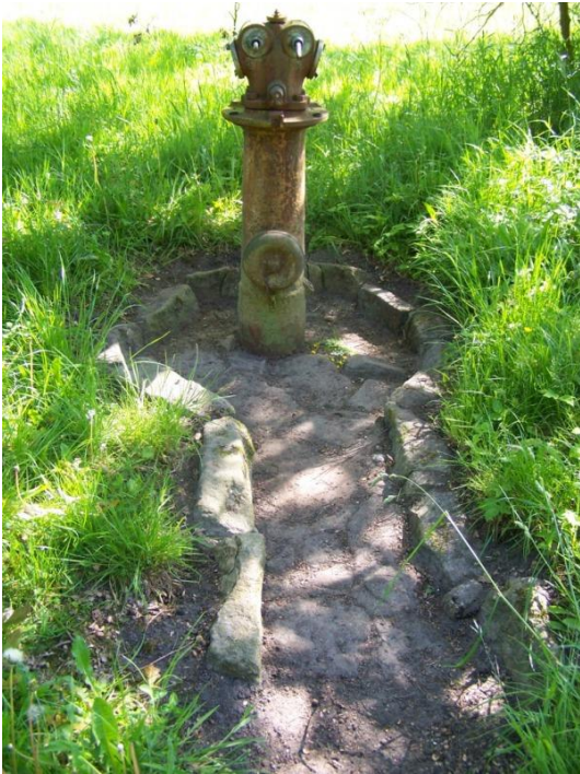
Hydranten. Foto: Jens-Christian Hansen, 2009.

Tidligere fangers beretninger, herunder selvbiografiske optegnelser eller interviews, kendetegnes ofte af fysiske referencepunkter. Genstande eller steder i og udenfor lejren går ofte igen på tværs af forfatterens nationalitet, hvorved disse referencepunkter bliver fælles erindringssteder. Ikke alle erindringssteder er bevaret fysisk, derfor er det vigtigt at bevare de få tilbageværende levn. De sprængte krematorier i Birkenau er eksempler på et levn, der samtidigt er erindringssteder. Forbrydelsernes omfang i Auschwitz-Birkenau og Husum-Schwesing kan ikke sammenlignes, men der er paralleller mellem krematorierne og brandhanen i Schwesing. Pga. sin transformation fra brandslukningsmateriel til afstraffelsesredskab har brandhanen en tilsvarende symbolsk betydning hos de overlevende. Hydranten symboliserer brutalitet. Som levn er den et bindeled, eller det, som Aleida Assmann betegner som en formidler mellem den nutid, som betragteren oplever genstanden i og den historiske datid, som den viser tilbage til og levendegør. 770 De udmattede og udhungrede fangers lidelser ved at stå i timevis i al slags vejr ved de daglige tælleappeller, knyttes til det fysiske sted; i Husum den brostensbelagte vej gennem lejren. For at formidle fangernes oplevelse af appellen, måtte dette originale levn synliggøres. Pga. problematiske ejerforhold skete