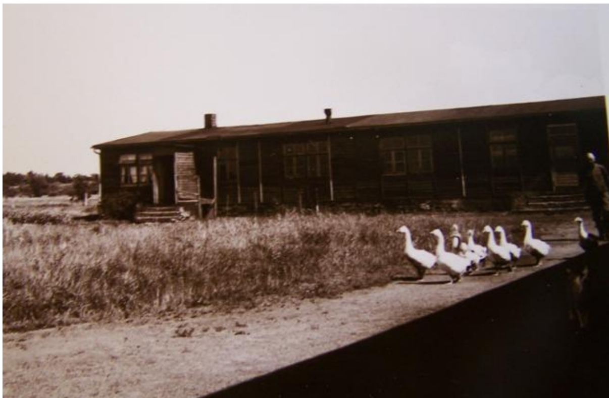
Flygtningelejren i Schwesing. Aabenraakredsens arkiv, Landsarkivet for Sønderjylland. Foto Jørgen Poulsen, 1950.