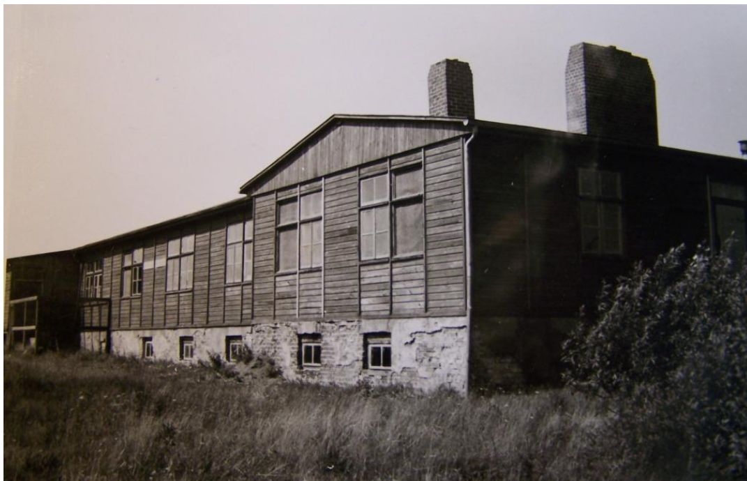
Kartoffelskrælleriet. Aabenraakredsens arkiv, Landsarkivet for Sønderjylland. Foto Jørgen Poulsen, 1950.

regn og rusk. Selv arbejdet i kartoffelskrælleriet var dog ikke risikofrit, hvilket bliver tydeligt gennem en begivenhed, der her skal belyses nærmere. Den fik senere også relevans for det juridiske efterspil. Episoden fremhæves tillige for at tydeliggøre betydningen af de fysiske levn efter kartoffelskrælleriet på det tidligere lejrområde. Relikterne kan dog udelukkende tjene til at beskrive hvor på området begivenheden har fundet sted. Hvad der er sket, kan kun rekonstrueres ud fra aktørernes beretninger, da de fysiske spor efter den pågældende hændelse er borte.