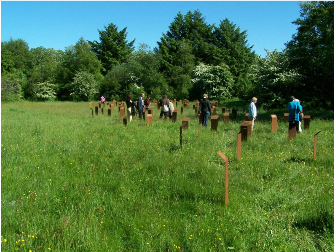
Mindelunden med stelerne, KZ-Gedenkstätte Husum-Schwesing Foto: Jens-Christian Hansen, 2009.

Et monument kan ikke gengive ofrenes oplevelse, men arkitekturen kan formidle ekkoer af deres sanseindtryk. I Schwesing rammes den besøgende straks af begreber som individ og masse, forvirring, ensomhed, og usikkerhed . På afstand ligner de rustne jernplader en anonym masse, der først ved en tæt betragtning åbenbarer deres forskellighed gennem de forskellige navne, der står på hver enkelt af dem. Stelerne selv, bukkede jernplader af rustent containerstål i forskellig højde, symboliserer de lidende, foroverbøjede fanger. 805 Symbolikken griber tilbage til kz-lejrens samtid, hvor ofrene forsøgte at bevare deres individualitet overfor sig selv og kammeraterne men af gerningsmændene reduceredes til "fangemateriale". 806 Den besøgende fornemmer ofrenes forvirring og usikkerhed i forhold til det, der skulle ske i kz-lejren. Dette formidles ved en nærmest tilfældig opstilling af stelerne; med ryggen til hinanden, uden symmetri eller med et bestemt referencepunkt – denne anordning var valgt bevidst for at symbolisere drabets tilfældighed. Den