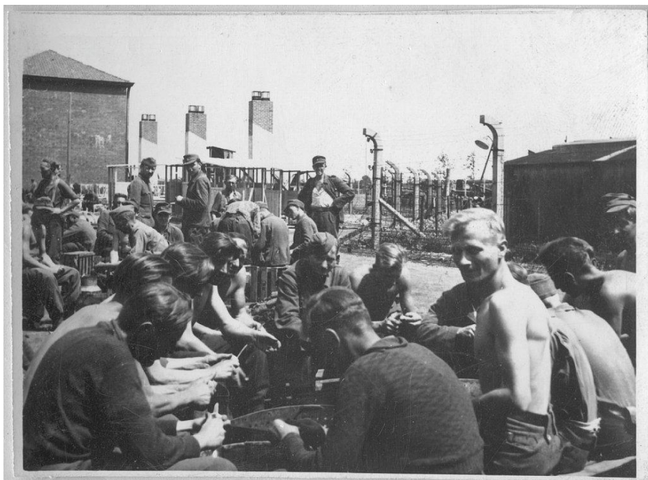
Tidligere SS-mænd i C.I.C. no. 6 / Neuengamme efter kapitulationen.