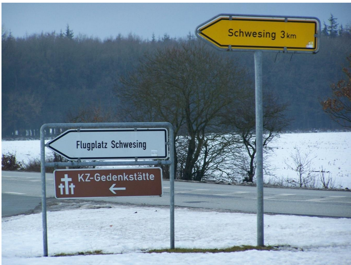
Skiltningen til KZ-Gedenkstätte Husum-Schwesing, vinteren 2012.