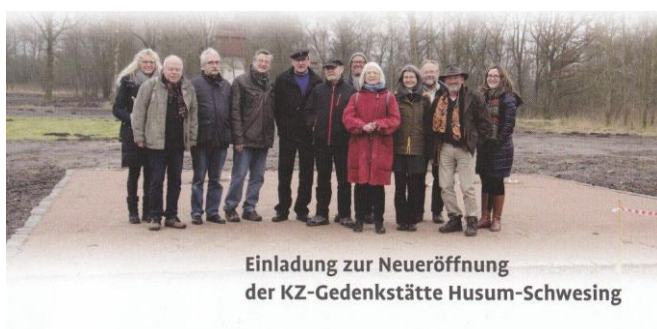
Invitation til indvielsen af det nykonciperede erindringssted, april 2017.

Efter dette kapitels afslutning har der fundet en nykonception af minde og erindringsstedet på det tidligere lejrområde sted. Den nye koncept skal åbne den 28. april 2017, altså kort tid før indlevering af denne afhandling. En komparativ analyse af erindringsstedets tidligere og nuværende udformning må derfor være genstand for en senere forskningsartikel.