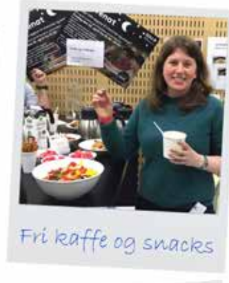
Fri kaffe og snacks