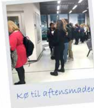
Køb til aftensmaden