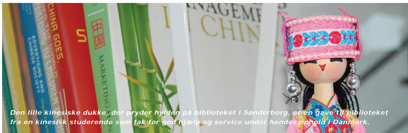
Den lille kinesiske dukke, der pryder hylden på biblioteket i Sønderborg, er en gave til biblioteket fra en kinesisk studerende som tak for god hjælp og service under hendes ophold i Danmark.