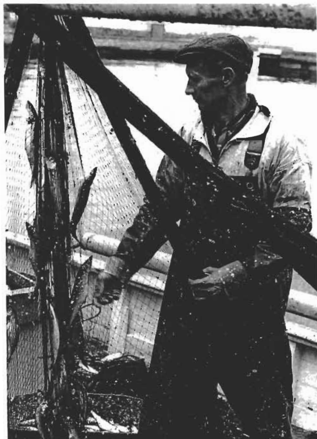
Sild pilles af garnet, Rønne

systemet, at små fartøjer med stor omstillingsevne og lave driftsomkostninger klarede sig godt. Derfor blev det en realistisk mulighed for mange fiskere at lægge penge til side, så de kunne købe egen kutter i en ung alder. Selveje og fri markedsøkonomi blev grundlaget i det danske fiskeri, mens samarbejde og andelstanke til trods for enkelte tilløb havde sværere kår. Fiskerne havde ganske enkelt erfaring for, at omstillingsevne var vigtigere end reguleret samarbejde, fordi fisken i havet skal fanges, når den er der, og specialisering og aftaler kunne blokere.