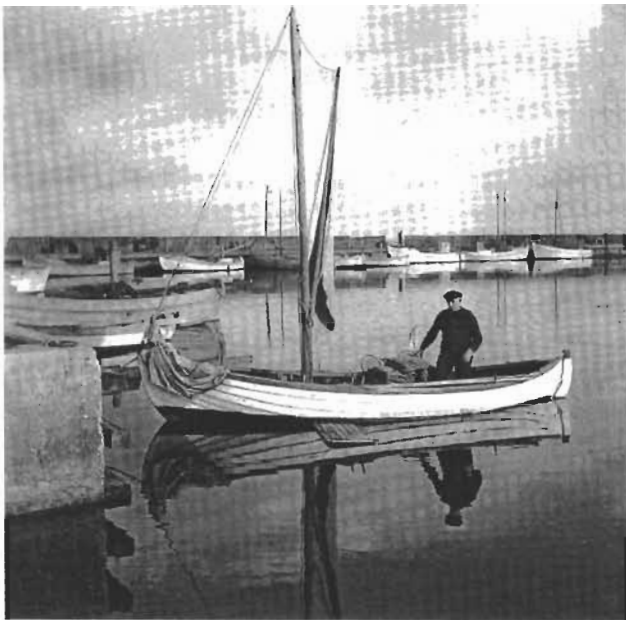
Sletten havn, efteråret 1949.

I dag længes de fleste fiskere tilbage til den tid og det øvrige samfund deler nostalgien. Ligesom vi hylder det rodfæstede selveje i landbruget, finder vi stor inspiration i tanken om havets frie fiskere og nyder historier om fandenivoldske fiskere, der trods almindelig lærdom og traditioner. På den måde er fiskerne ikke kun en erhvervsgruppe som alle andre, men et selvstændigt kulturelement i den danske tradition.