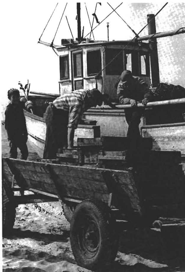
Fangst landes i Stenbjerg, 1969.

Fiskeriet har en stolt fortid at bygge på, men det er ikke givet, at fiskerierhvervet kommer til at skabe sin fremtid på fortiden. I praksis er fiskeripolitikken nemlig udformet i strid med erhvervskulturen.