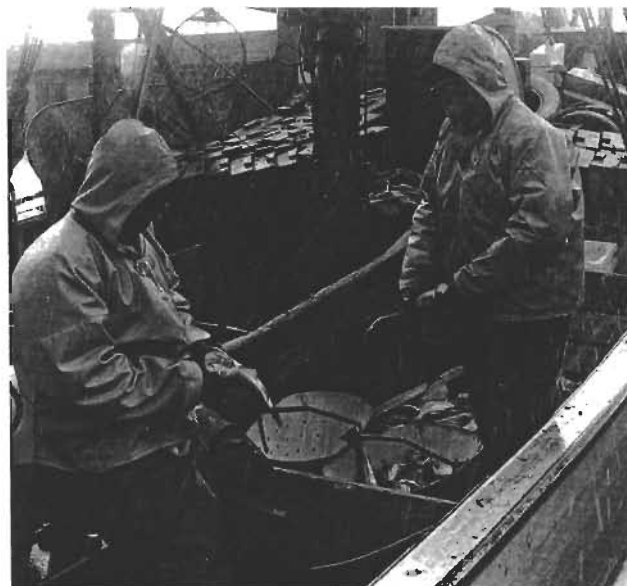
Fisken renses, 1977.

Fremtidens politik for de fiskeriafhængige lokalsamfund må inddrage sociale og kulturelle forandringer og prioriteringer ved siden af de biologiske og økonomiske omstændigheder. Hvis de danske kystsamfund skal overleve, må fiskeripolitikken befordre muligheden for at drive erhverv i fiskerihavnene. Forskning i fiskerierhvervets sociale omstillingsproces vil derfor være af betydning såvel