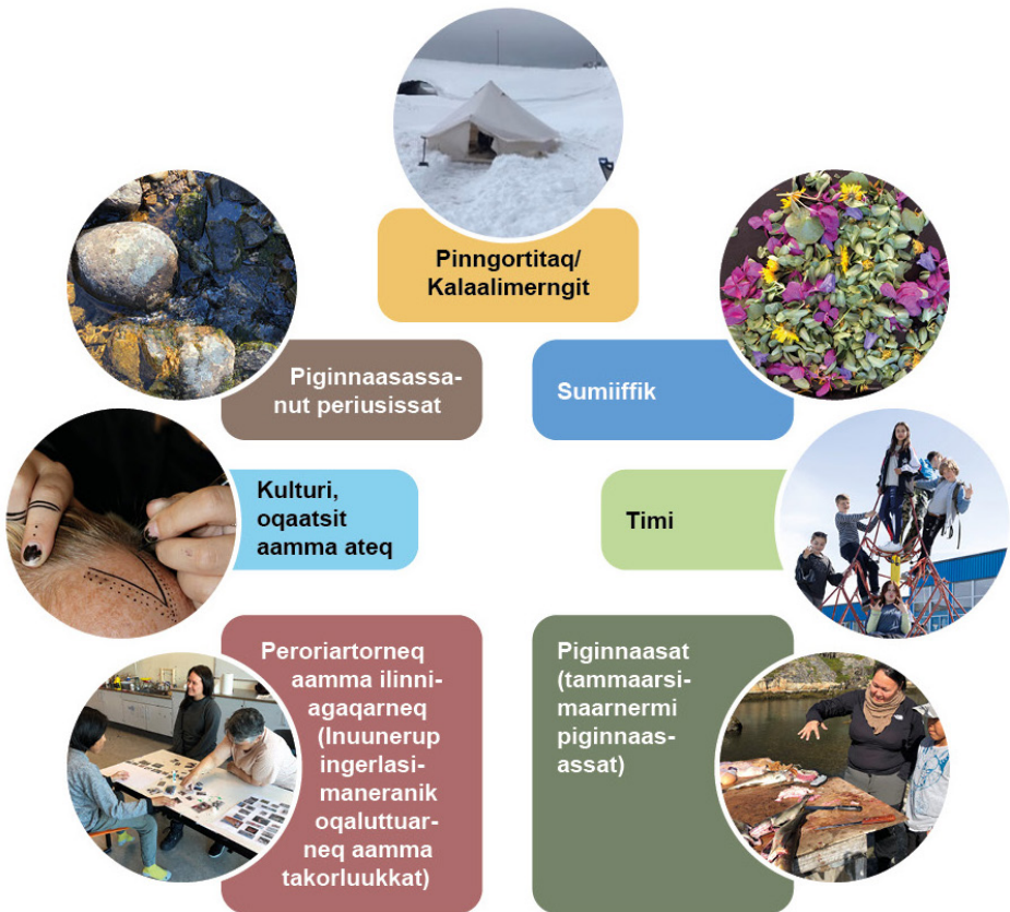
Takussutissiaq 1. Naleqartitanut iluseq, KI-campinik ineriartortitsineranut tunngavisoq

Ilutsimi matuma ataani takutinneqartutut KI-campit tunngaviusumik naleqartitanik tunngaveqarput (Rubin et al., 2024). Naleqartitat tassaap-put timimut, peqqissutsimut, kulturikkut kinaassutsimut aamma sumiiffimmut pinngortitamullu atassuteqarnermut, kiisalu inuit ataasiakkaat siusinnerusukkut inuunerannut aamma siunissami inuunerisassaannut, aamma pinngortitami angalaarsinnaanermut aamma inuunermi unamilligassanut tunngatillugu qaangiisinnaanerannut tunngassutillit.