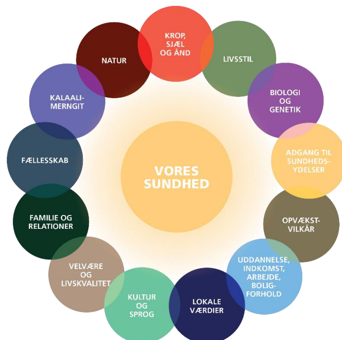
Figur 1: Determinanter for Vores Sundhed (Center for Folkesundhed i Grønland).

Alle disse elementer af det gode liv kan genfindes i modellen Determinanter for Vores Sundhed , som er udviklet af Center for Folkesundhed i Grønland, og som ligger til grund for arbejdet Inuuneritta III (Inuuneritta III 2020:20)