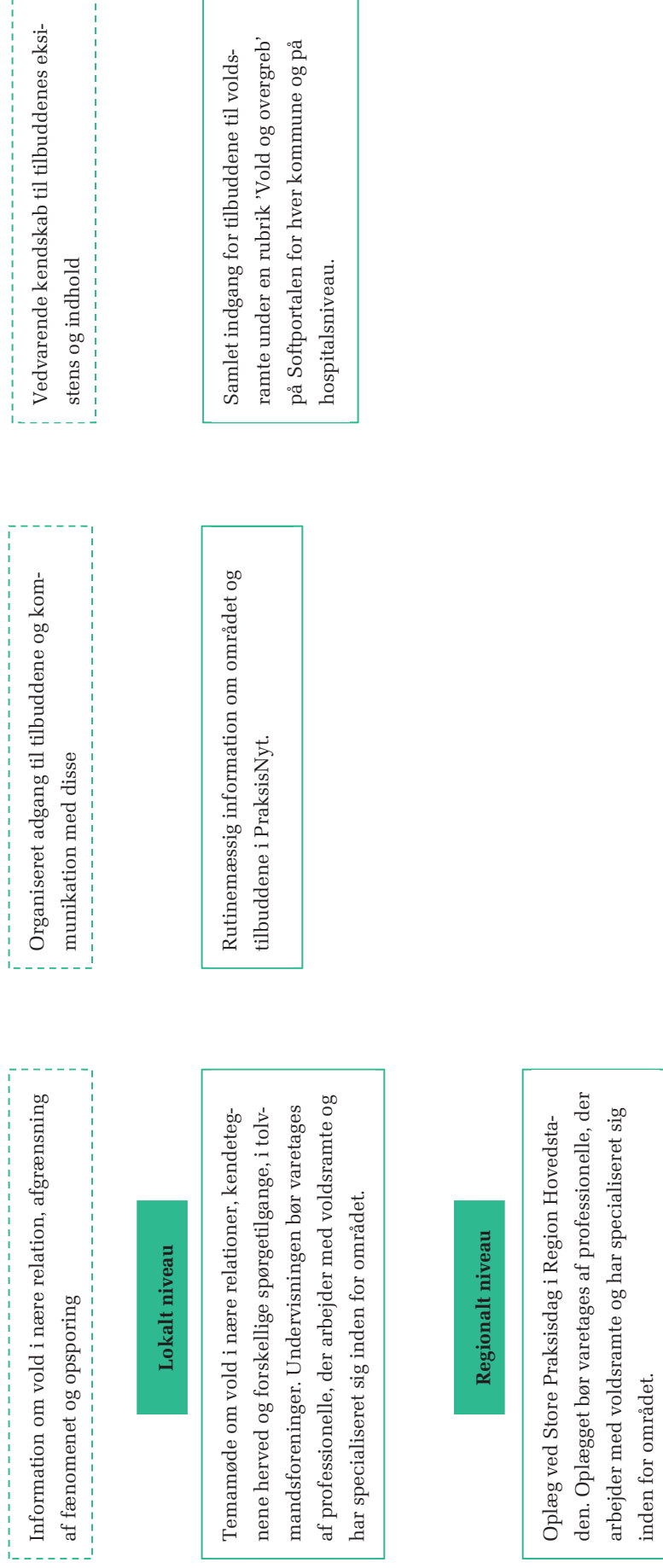
Figur 2. Model til et øget tværsektorielt samarbejde