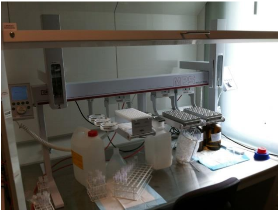
Figur 2 Ekstraktionsrobot fra Gerstel

Vi har et travlt, men spændende forløb foran os, som kræver en stor indsats af personalet. Vi ser frem til at kunne løfte servicen yderligere og glæder os til det fortsatte gode samarbejde.