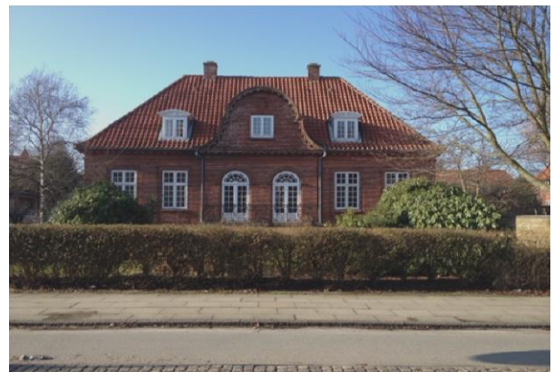
Figur 4 Det Regionale Børnehus i Odense

I oktober 2013 åbnede Det Regionale Børnehus Syd i Odense, den 01.03.2014 åbnede så afdelingen i Esbjerg. Det skal lige som huset i Odense samle alle aktiviteterne vedrørende børn udsat for overgreb. Som i Odense kan alle interessenterne desværre ikke få plads i huset, så børnelæger og retsmedicinere vil fortsat sammen undersøge børnene på OUH. Alle børn, der frygtes udsat for seksuelle overgreb, skal i forvejen undersøges på OUH, men visse undersøgelser, som foretages af børnelæger alene, vil kunne foregå hos Børnehusets nye samarbejdspartner i Esbjerg, Sydvestlysk Sygehus. Børnehuset i Esbjerg vil primært tage sig af sager fra kommunerne, der ligger i Syd- og Sønderjyllands Politikreds, mens de kommuner, der ligger i Sydøstjyllands og Fyns Politikredse, fortrinsvis vil benytte Børnehuset i Odense.