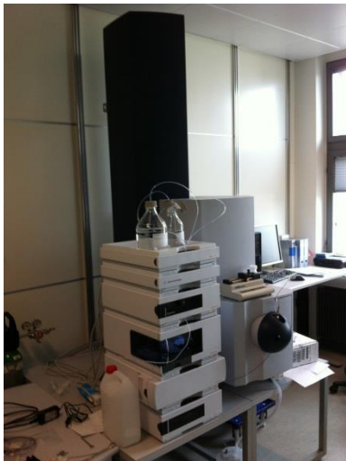
Figur 3 Impact HD analyseudstyr fra Bruker til udførelse af screeninger