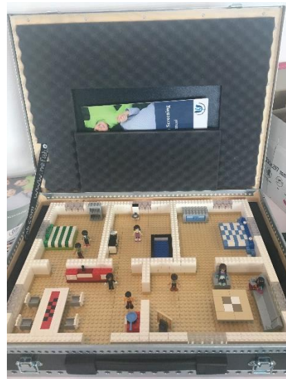
OCTS-kuffert og figurer