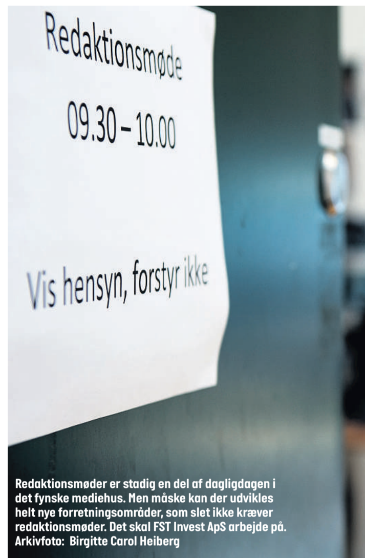
Redaktionsmøder er stadig en del af dagligdagen i det fynske mediehus. Men måske kan der udvikles helt nye forretningsområder, som slet ikke kræver redaktionsmøder. Det skal FST Invest ApS arbejde på.

- Med etableringen af investeringselskabet og de ambi-