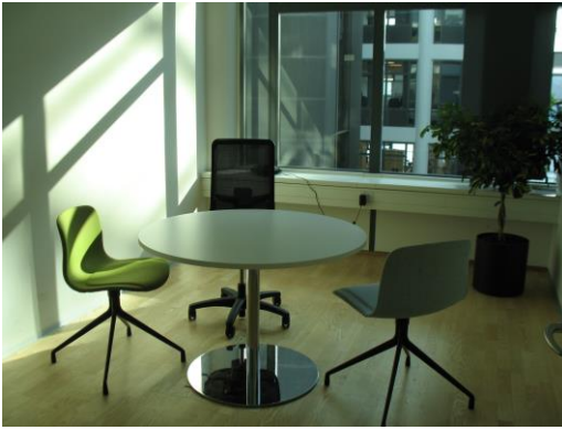
Billede 8: Internt mødelokale hos KPMG