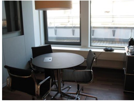
Billede 9: Eksternt mødelokale hos KPMG

Ligeledes hos Lead Agency er det særligt interessant at se på, hvordan ledelse og medarbejdere Implicit har klassificeret nogle af deres mødelokaler. Eksempelvis har et mødelokale fået navnet Bestyrelseslokalet, som er indrettet med et rektangulært bord og Eames Group stole, og et andet har fået navnet Samtalerummet, som er indrettet med to bløde lænestole og en minibar. Indretningen afforder to forskellige møde- og arbejdsprocesser, hvilket indfanges klart i klassificeringen. For at tydeliggøre dette kan det nævnes, at ledelsen i sjov nævnte, hvordan det var kendt blandt medarbejderne, at man blev fyret i Bestyrelseslokalet og ansat i Samtalerummet.