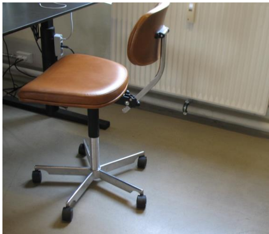
Billede 1: Kevi stol hos Lead Agency

Hos Lead Agency var arbejds møblerne valgt på baggrund af æstetiske principper frem for funktionelle. Det betød, at hæve/sænke borde og justerbare kontorstole var valgt fra i indretningsprocessen, fordi de ofte ikke har et pænt design. Arbejds møblerne lever derfor ikke op til kravene fra Arbejdstilsynet, fordi de ikke er ergonomisk sunde eller behagelige at sidde stationært i en hel dag, hvilket medfører, at medarbejderne ikke må sidde på den samme plads i mere end to timer ad gangen. Kontoret er derfor indrettet med flere arbejdsstationer med forskellige sidde og ståpladser. Arbejds møblerne, både de forskellige stole og borde, bliver derfor Aktører i at afforde en potentiel Forandringsproces, hvor medarbejderne bevæger sig rundt på kontoret med de andre arbejds møbler som Mål. Denne affordance opstår særligt på baggrund af delelementer på Komponentniveau, hvor det for kontorets Kevi stole handler om det lave ryglæn og den manglende mulighed for at justere stolens sæde og ryglæn. Her er der altså tale om en affordance, der hænger sammen med noget ergonomisk, hvor det gør ondt i kroppen at sidde det samme sted for længe.