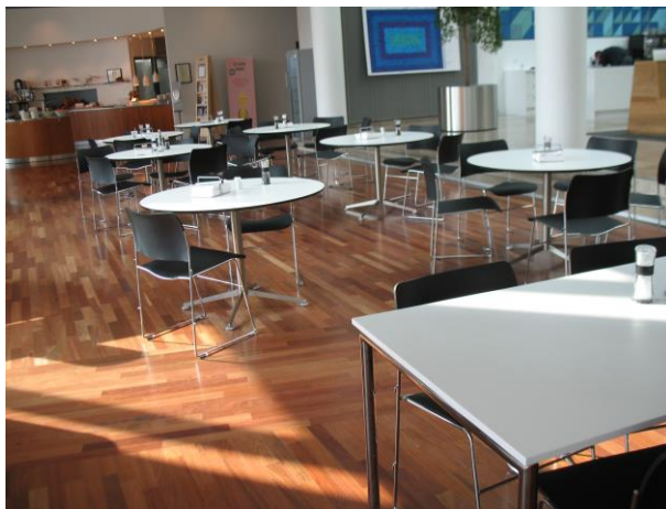
Billede 2: Kantinen hos KPMG

Billedet nedenfor skal illustrere området med de rektangulære borde og de runde borde. De høje cafeborde er placeret til venstre uden for billedet.