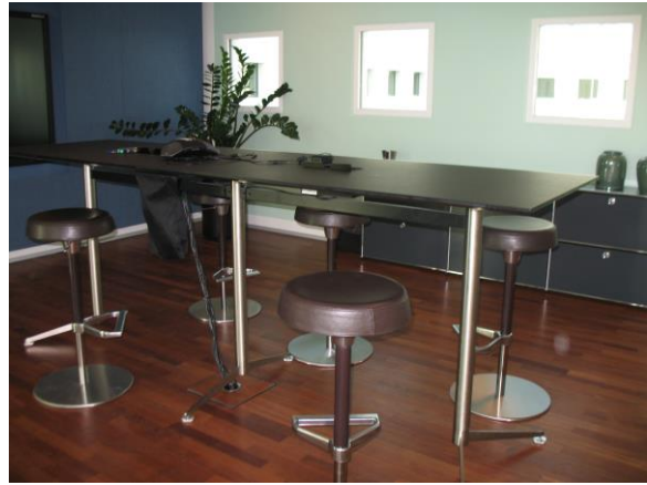
Billede 4: Mødelokale ved KPMG

En Materiel proces kan også affordes gennem farvevalg. Hos Lead Agency havde man valgt at indrette kantinen med grønne borde. Borde og stole i en kantine er naturligvis Aktører i at afforde en potentiel Opretholdelsesproces, hvor medarbejderne sidder og spiser. Det særlige farvevalg gør dog, at der affordes en særlig adfærd imens. Farvevalget kan være med til at afforde en potentiel Opretholdelsesproces, hvor man sidder og spiser under en løssluppenhed med høje samtaler, stor gestik og latter. Rumindretningen kan her anskues som en katalysator for en potentiel Ekspressiv adfærdsproces, hvilket berøres nærmere i afsnittet om et integreret socialsemiotisk og kognitivt Designstratum. Farvevalget kan også anskues som en potentiel Symbolsk proces, men ved at beskrive det som en potentiel Opretholdelsesproces er der fokus på, at der affordes en potentiel handling og ikke et symbol herpå.