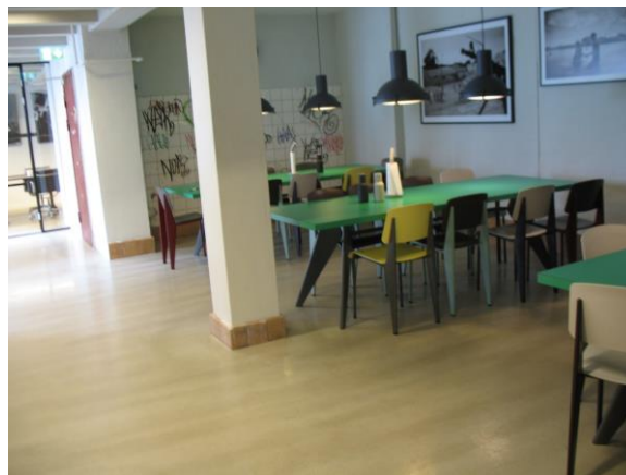
Billede 5: Kantinen hos Lead Agency

En Materiel proces kan også affordes gennem farvevalg. Hos Lead Agency havde man valgt at indrette kantinen med grønne borde. Borde og stole i en kantine er naturligvis Aktører i at afforde en potentiel Opretholdelsesproces, hvor medarbejderne sidder og spiser. Det særlige farvevalg gør dog, at der affordes en særlig adfærd imens. Farvevalget kan være med til at afforde en potentiel Opretholdelsesproces, hvor man sidder og spiser under en løssluppenhed med høje samtaler, stor gestik og latter. Rumindretningen kan her anskues som en katalysator for en potentiel Ekspressiv adfærdsproces, hvilket berøres nærmere i afsnittet om et integreret socialsemiotisk og kognitivt Designstratum. Farvevalget kan også anskues som en potentiel Symbolsk proces, men ved at beskrive det som en potentiel Opretholdelsesproces er der fokus på, at der affordes en potentiel handling og ikke et symbol herpå.