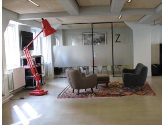
Billede 7: Venteområde hos Lead Agency

vil stå og læse i avis (hvor avisen kan ses som en Possessiv Attribut), der bliver den stærkeste affordance. Dermed bliver sofaen blot en Eksistent, en grundlæggende væren, fordi den ender med at stå til pynt. Dette skyldes nogle delelementer på Komponentniveau som siddehøjde og den bløde polstring, men også den intimitet en sofa som siddeplads medfører. Tilsammen bevirker disse, at sofaen som siddeplads ikke fremstår som en oplagt affordance i situationen. Der kan her siges at være det stik modsatte på spil end tilfældet med receptionsbordet. Den potentielle Klassificerende proces er med til at styrke en affordance om, at man sætter sig og venter i venteområdet, men denne affordance bliver indskrænket af konteksten.