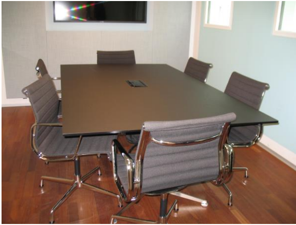
Billede 3: Mødelokale ved KPMG

Det er to forskellige mødeprocesser, indretningen afforder, hvilket har betydning for, hvornår man vælger hvilket mødelokale afhængig af agendaen og mødets formalitet.