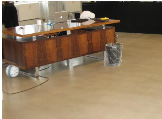
Billede 6: Receptionsbord hos Lead Agency

det er et gammelt direktørskrivebord fra den berømte konkursvirksomhed Nordisk Fjer. Ligesom arbejdsmøblerne er receptionsbordet ikke ergonomisk behageligt eller sundt at sidde ved i længere tid, hvorfor det heller ikke opfylder kravene fra Arbejdstilsynet. Derfor skiftes de yngre ansatte til at dække vagten i receptionen fra dag til dag. At bordet er ubehageligt at sidde ved i længere tid, burde virke som en indskrænkende affordance, der betød, at medarbejderen valgte at sidde et andet sted. I stedet opholder den, der har ansvaret for receptionen, sig ved bordet under hele vagten. Det er en potentiel Klassificerende proces, der benævner bordet som det område, receptionisten skal opholde sig ved, hvilket ender med at være den stærkeste affordance. Derfor er bordet Aktør i at afforde en potentiel Opretholdelsesproces, for den der har receptionsvagten.