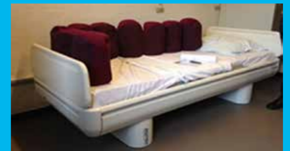
OPI-projektet 'Fremtidens Psykiatri Seng'

Siden OPI-projektets afslutning har netværkskonsortiet vundet en udbudsrunde, 'Psykiatrien i Region Syddanmark' og 'Region Hovedstadens Psykiatri' lanceret i 2014.