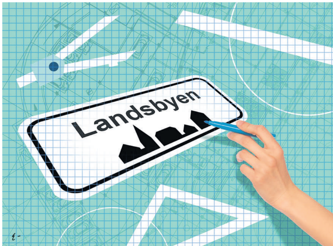
Illustration: Gert Ejton

HVOR LIVET I de større byer er centreret om rummet inden for byzonen, har levevilkårene for folk på landet til alle tider været betinget af rummet omkring