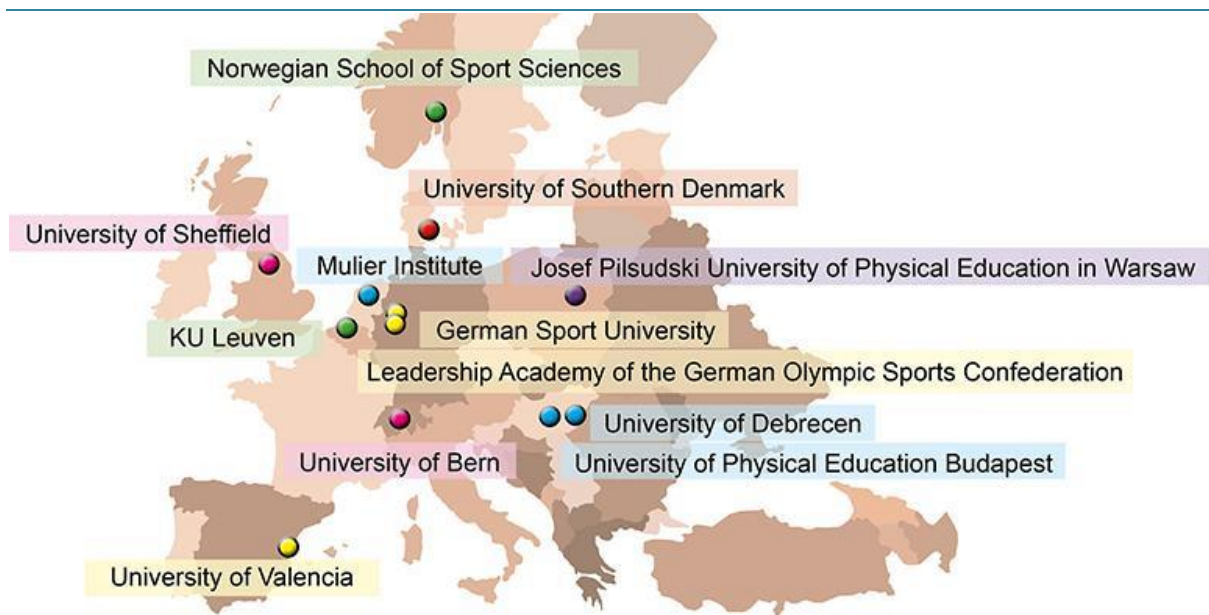
1 ábra: SIVSCE közreműködő partnerei