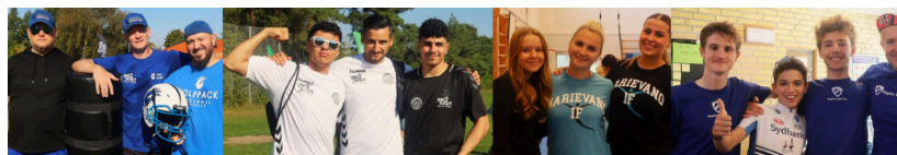
Figur 1 – Invitation til foreningerne om deltagelse i 'kick-off-event'

Mulighederne for at deltage i fritidsaktiviteter introduceres for eleven gennem samtaler med lærerne, men også via forskellige inspirationsaktiviteter. Blandt andet afholdes der en årlig foreningsdag, den såkaldte 'kick-off'-event, hvor lokale foreninger præsenterer deres tilbud for eleverne. I 2024 var der 12 foreninger til foreningsdagen, mens der i 2025 var 18 foreninger repræsenteret (se figur 1).