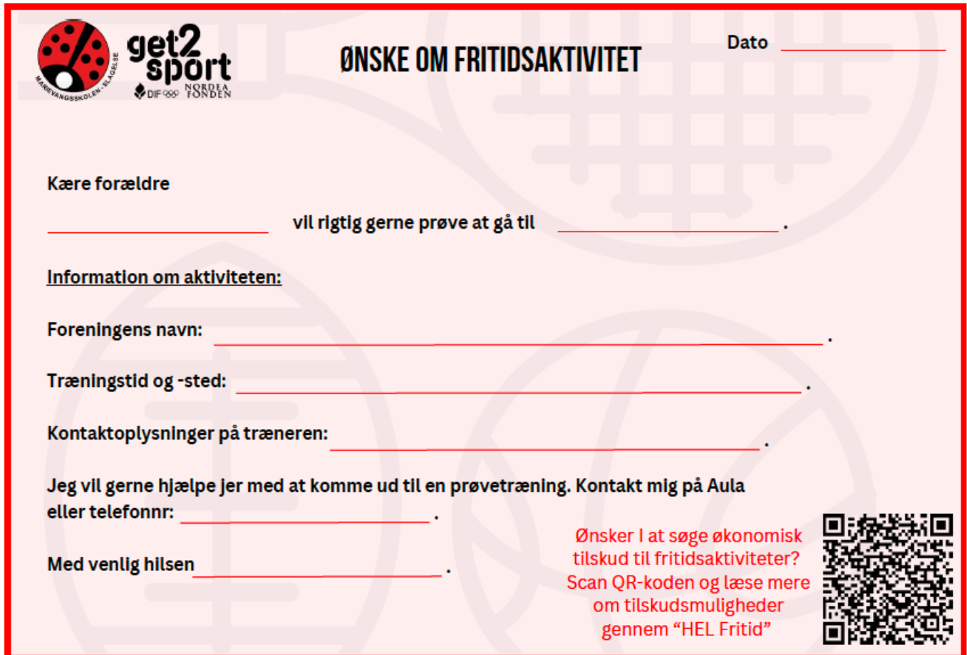
Figur 3 – Fysisk seddel, som sendes med elever hjem til forældre

Et opmærksomhedspunkt på baggrund af erfaringerne fra Marievangsskolen Get2Sport er dermed, at flere af aktørerne er optaget af, hvordan dialogen med forældrene kan udvides og uddybes. Det er afgørende for at barnet starter og fastholdes i en fritidsaktivitet, at flere forældre involverer sig i de samtaler, der peger frem mod en afklaring af, om det kunne være noget for deres barn at deltage i en fritidsinteresse. De mere håndholdte henvendelsesmetoder med at sende et kort med hjem, eller kontakte direkte via telefon, synes på baggrund af erfaringerne at være mere succesfulde end at henvende sig via mail eller Aula.