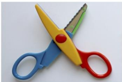
(Illustration fra pexels.com)