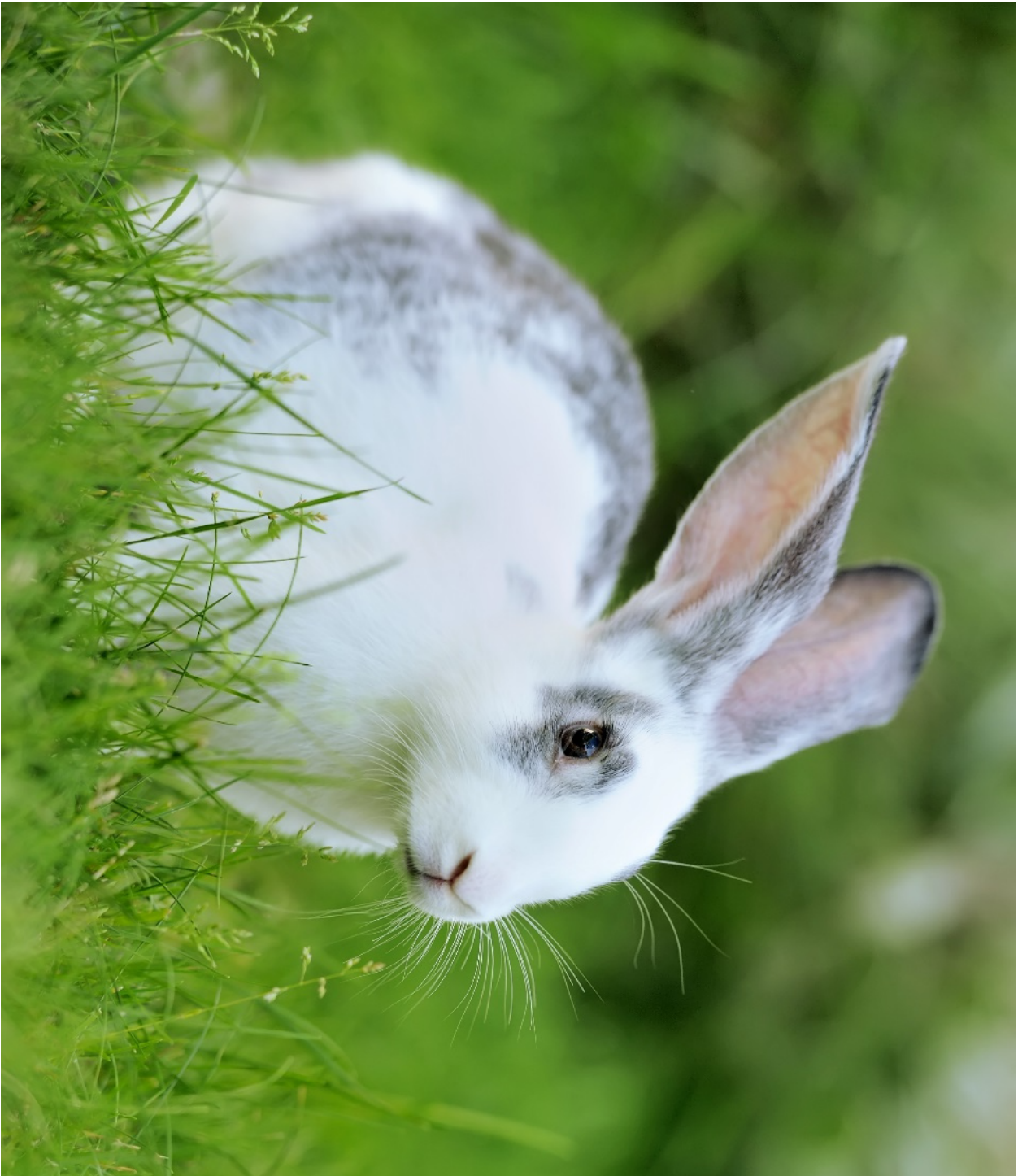
Figur 9. www.colourbox.com