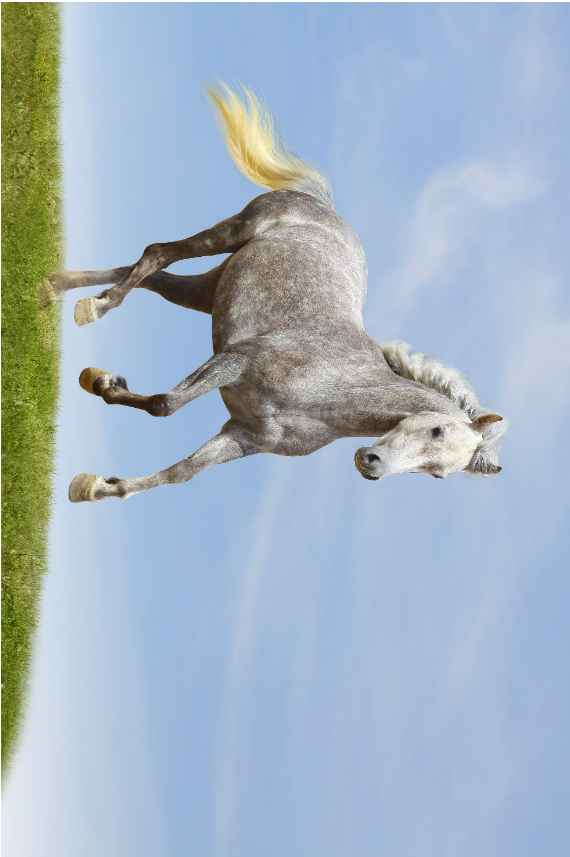
Figur 2.