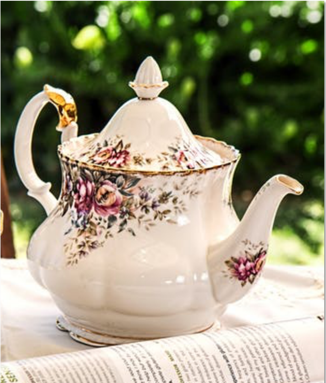
Figur 10.