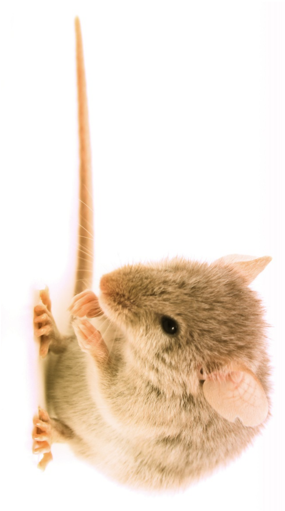
Figur 3.