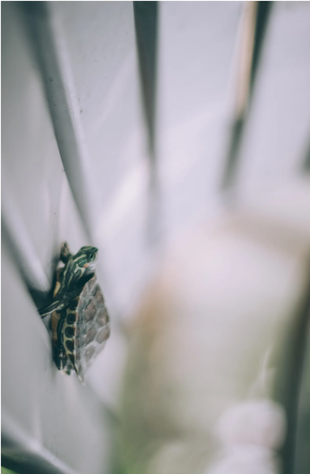
Figur 18.