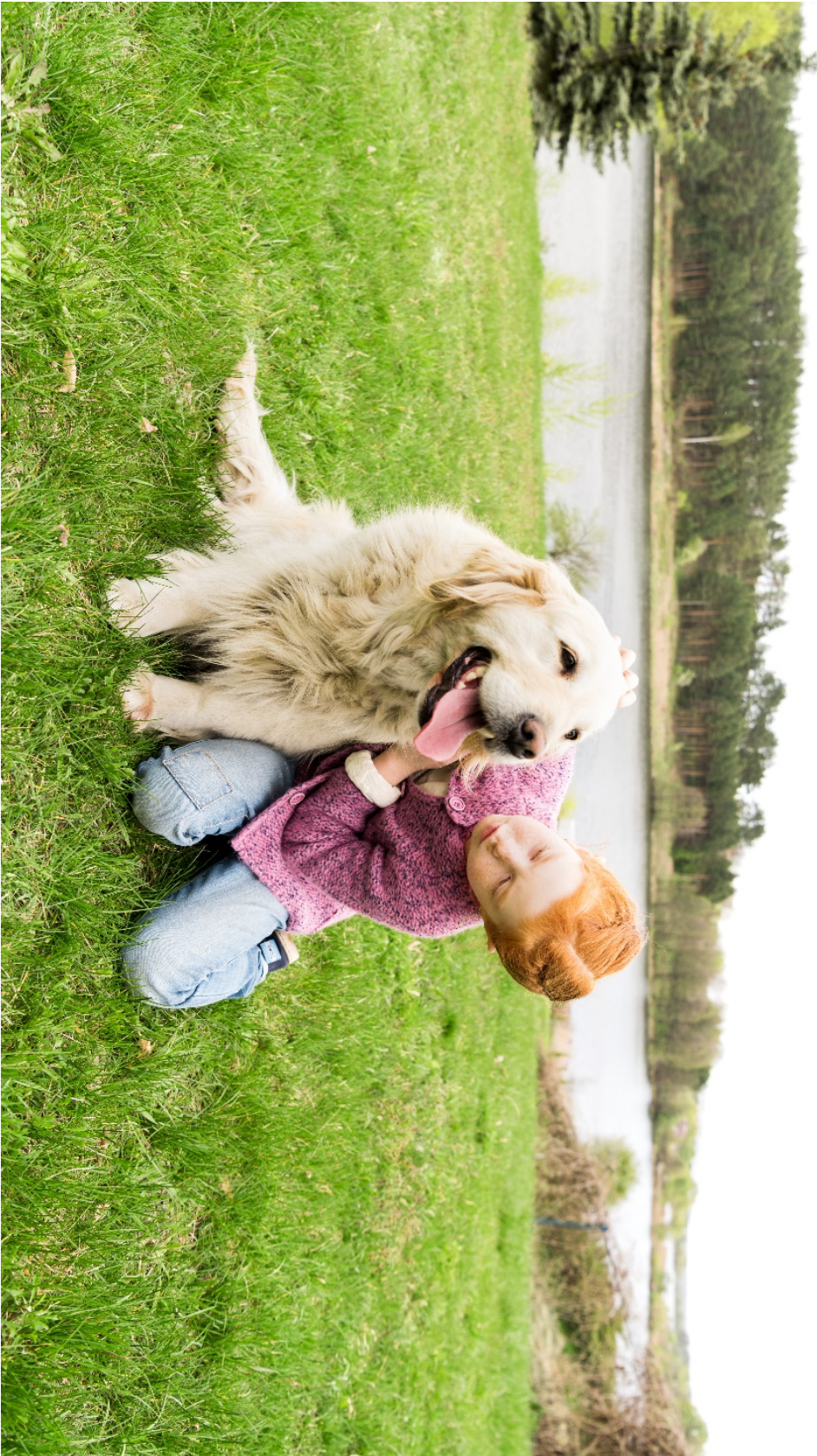
Figur 15. www.colourbox.com