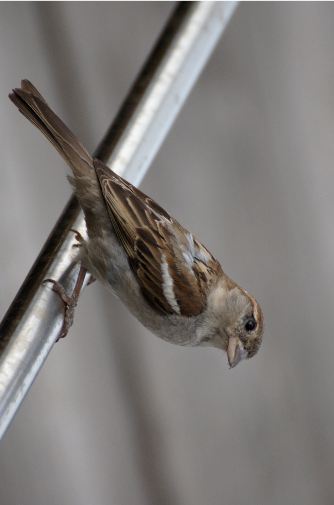
Figur 7.