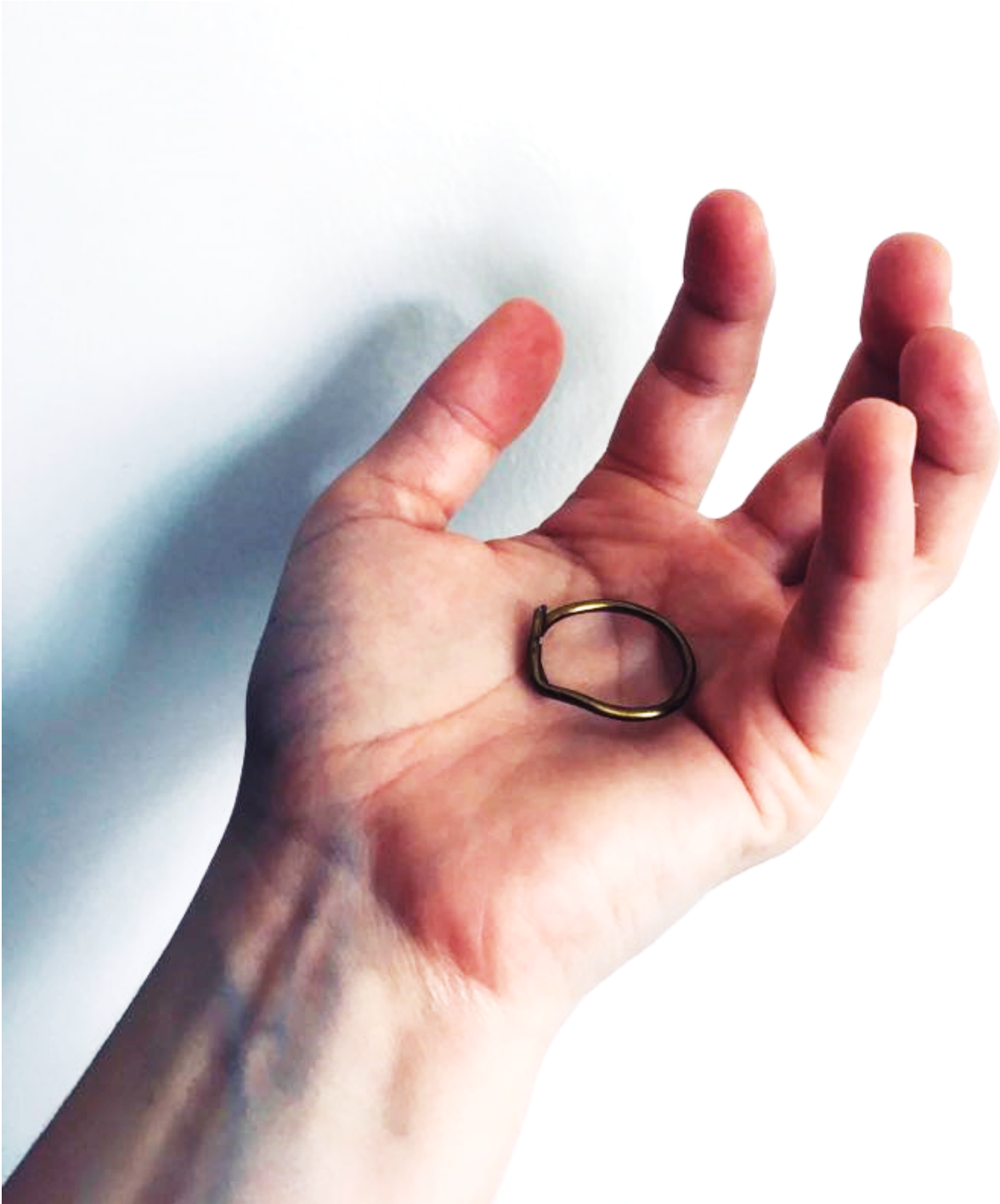
Figur 11. Filosofi i Skolen