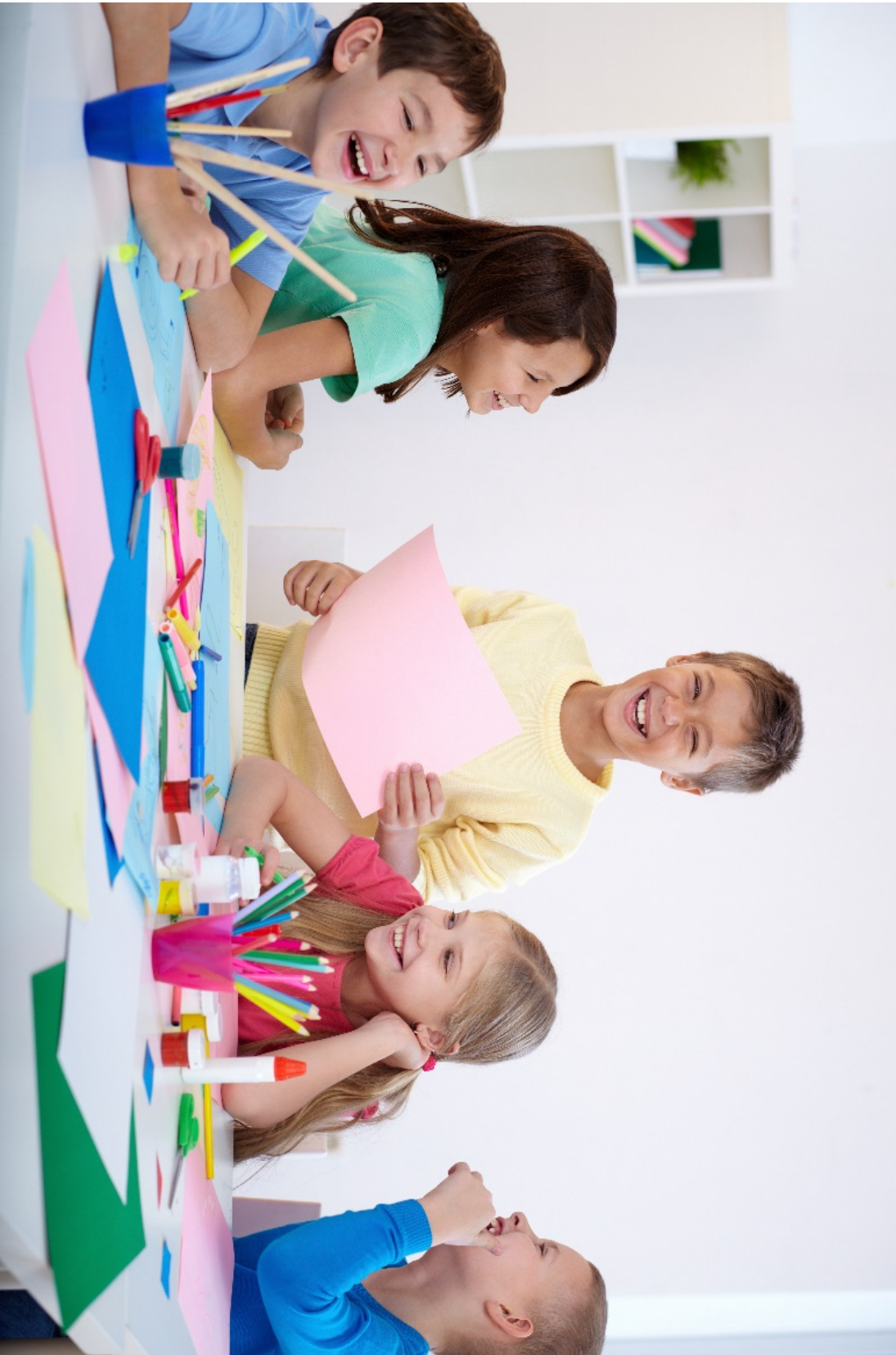
Figur 14.