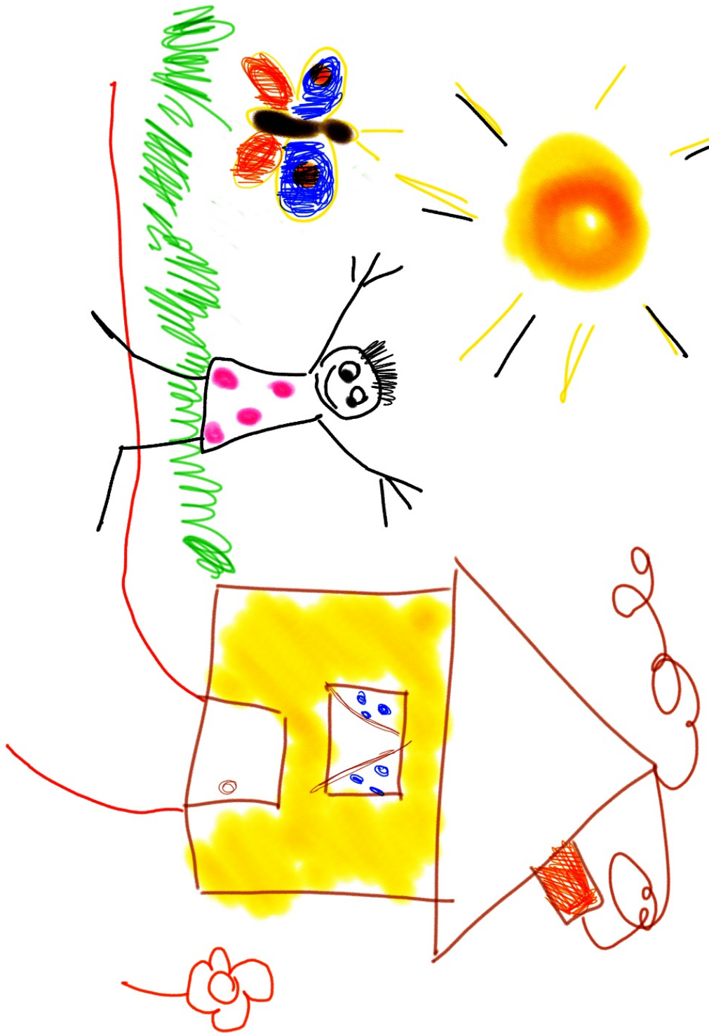
Figur 16.