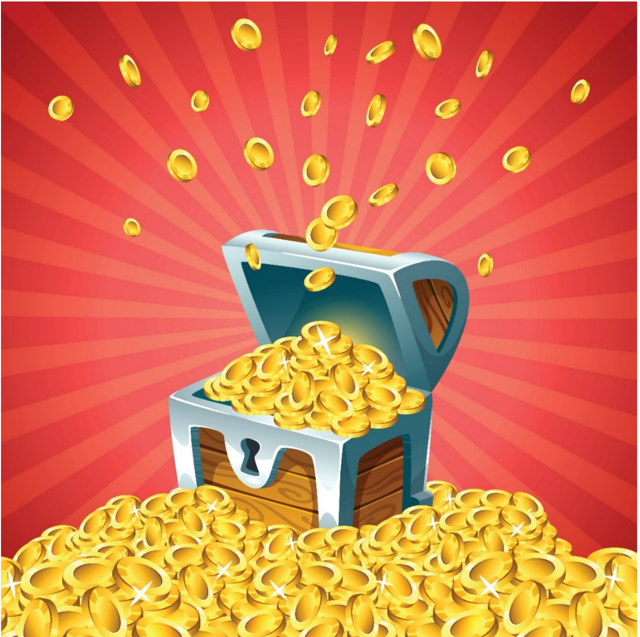
Figur 13.