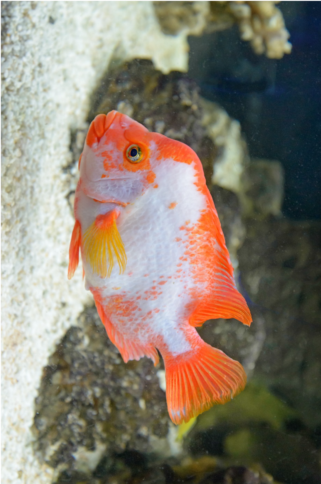
Figur 5.