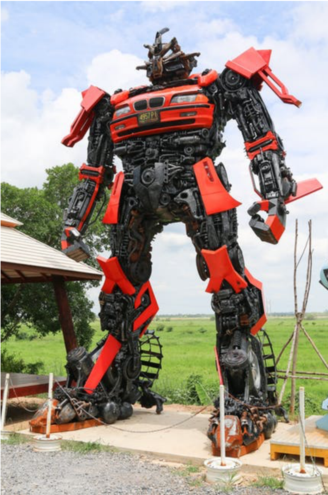
Figur 17.