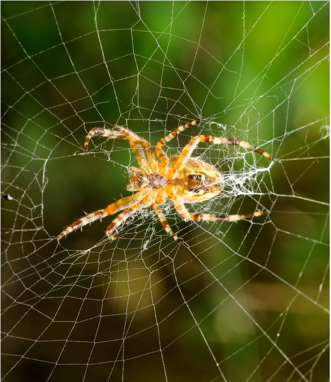
Figur 4.