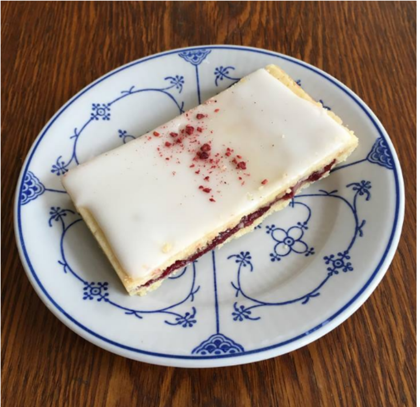
Figur 1. Filosofi i Skolen