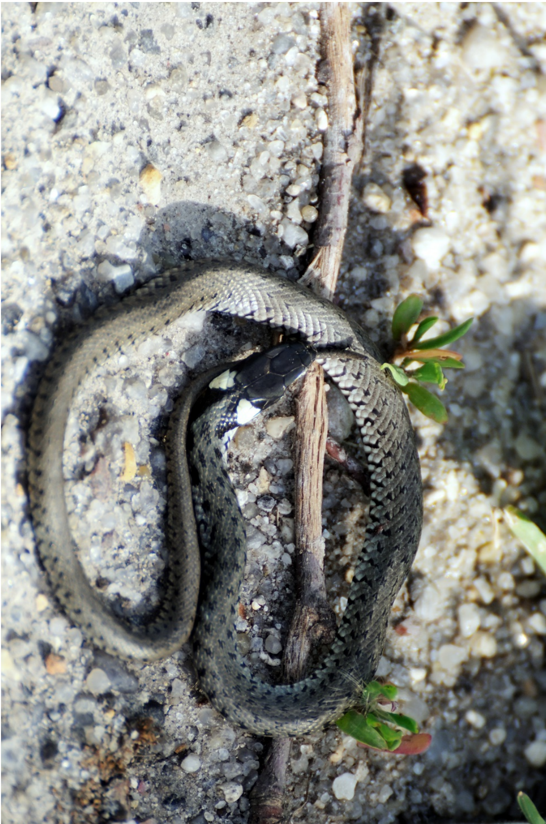
Figur 8.