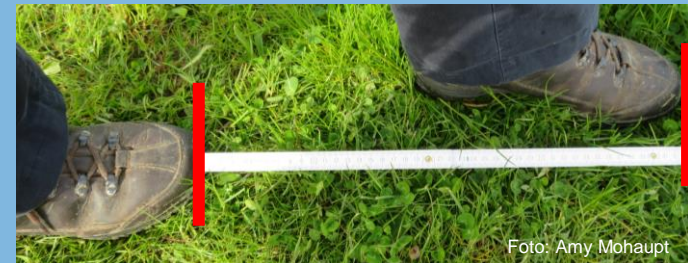
Længden af ét skridt fra tå til tå

Mål længden af ét skridt fra tå til tå. Brug derefter en skridttæller eller app til at tælle antallet af dine skridt rundt om søen. Bliv på stierne. Hvor stor er søens omkreds (O) og areal (A) i meter?