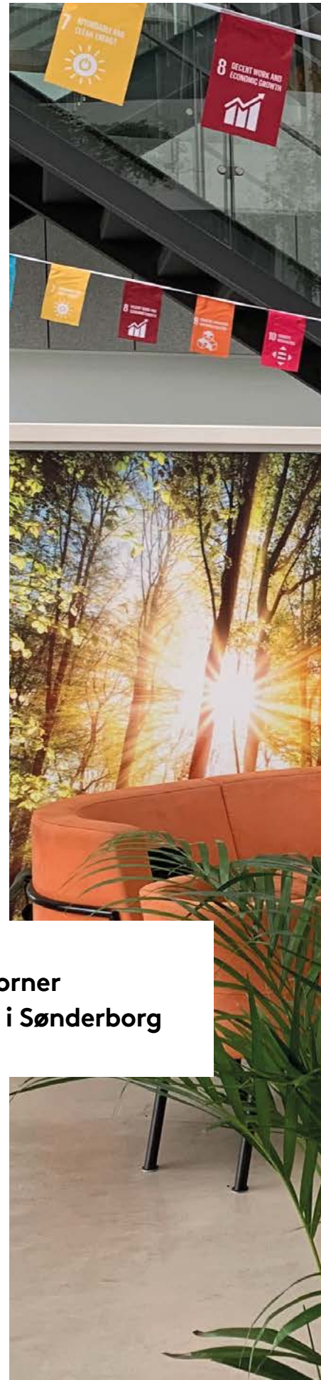
The Green Corner - biblioteket i Sønderborg